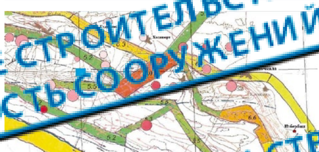
Рисунок 2 — Схема сейсмогеологических элементов при ДСР района строительства