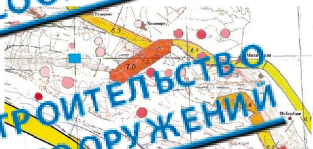
Рисунок 1 — Схема сейсмогеологических элементов при ОСР района строительства

Общезвестно, что оценка сейсмической опасности является результатом проведения трех видов сейсмического районирования, различающихся по масштабам задачам и объектам исследования: общего, детального и микро-районирования. Общее сейсмическое районирование согласно нормативу [1] представляет оценку сейсмической опасности на территории всей страны и имеет государственное значение для осуществления рационального землепользования и планирования социально-экономического развития крупных регионов. Масштаб карт общего сейсмического районирования (ОСР) содержится в работе [13]: «Именно на этой карте общей сейсмической районирования (ОСР) территории всей страны определены интенсивность сотрясений, возможных на участке строительства. Эти карты имеют очень большое значение для проектировщиков при принятии проектных решений и напрямую влияют на стоимость строительства». Очевидно различие в оценке значения ОСР, в последнем случае оно сильно преувеличено.